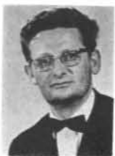
Jacques DUGAS-VIALIS Photographe le Cantonnaïu