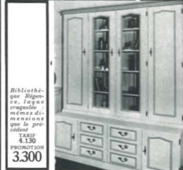
Bibliothèque Régence, laque craquelée : mêmes dimensions que le précédent. TARIF 4.130 PROMOTION 3.300

Ces 3 ensembles GRIFFON sont en vente chez GAROLA