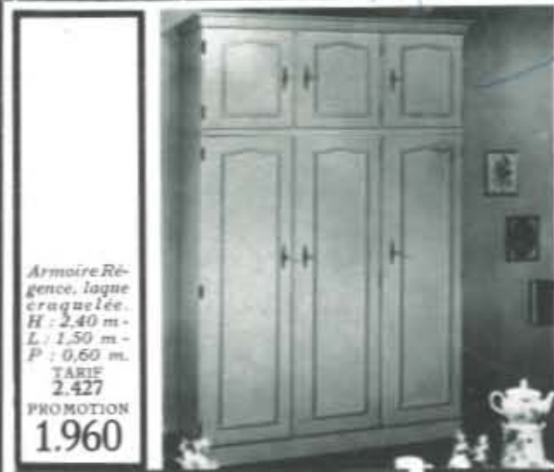
Armoire Régence, laque craquelée. H: 2,40 m - L: 1,50 m - P: 0,60 m. TARIF 2.427 PROMOTION 1.960