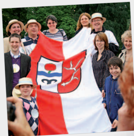
Les athlètes d'outre-Rhin en pleine forme