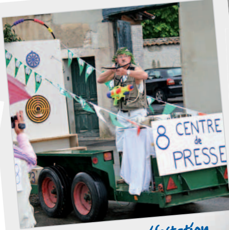
Dans toute manifestation sportive... la presse prête à décocher ses flèches...