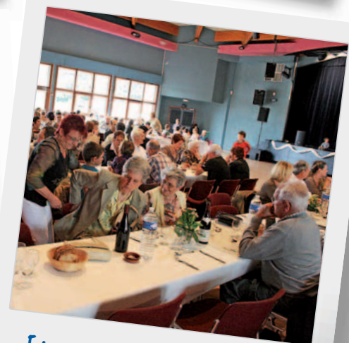
Et pour finir, un banquet, bien sûr!