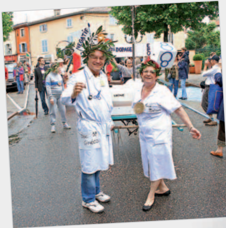
Le contrôle anti dopage n'est jamais loin!