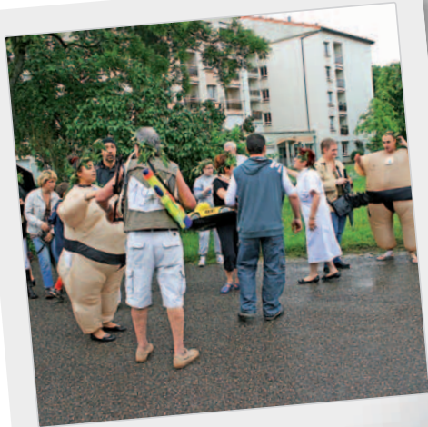
Rassemblement matinal aux Arcades...