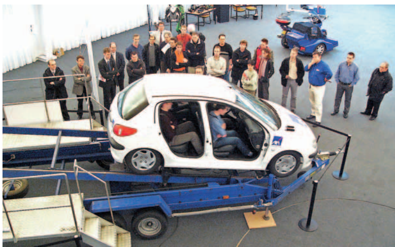
Pour la 1 re fois en Rhône-Alpes, le simulateur de choc frontal « Autochoc »

Que ressent-on lors d'un choc frontal ? Quels sont les gestes qui sauvent ? Les effets de l'alcool sur la vision ? Chacun pourra trouver réponse à ces questions le 20 septembre, place d'Hirschberg où seront rassemblés, de 9h à 17h, tous les partenaires de l'opération (les secouristes de la Croix blanche, les assureurs AXA, AGF, MMA, la