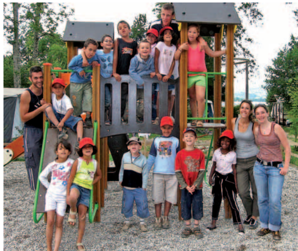
Sorties en tous genres et souvenirs ensoleillés

Renseignements : Service Enfance-jeunesse / Le Forum au 04 72 31 84 00 – forum@mairie-brignais.fr Centre social et socioculturel au 04 72 31 13 32