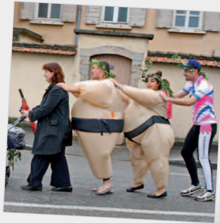
... ou à la queene leu leu