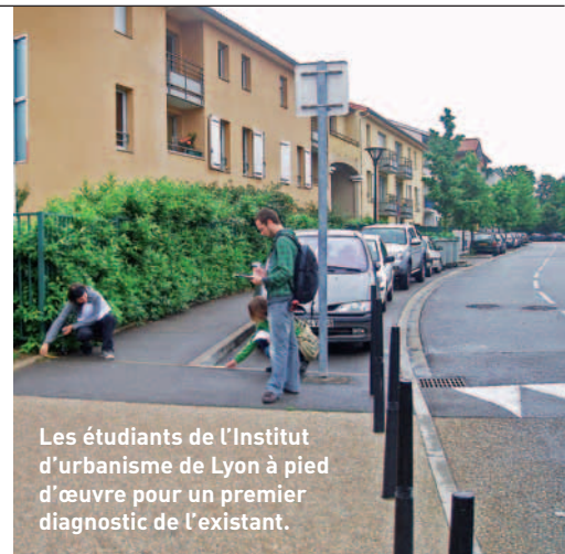
Les étudiants de l'Institut d'urbanisme de Lyon à pied d'œuvre pour un premier diagnostic de l'existant.

Elle devra également recenser l'offre des logements accessibles, sans pour autant se substituer aux commissions de sécurité et d'accessibilité chargées de se prononcer sur la conformité à la réglementation des projets de construction. ■