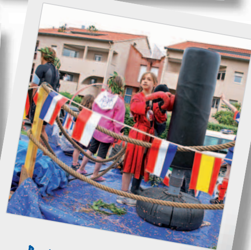
Petit(e)... mais costaud!