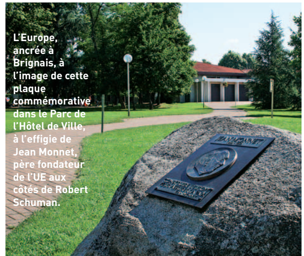
L'Europe, ancrée à Brignais, à l'image de cette plaque commémorative dans le Parc de l'Hôtel de Ville, à l'effigie de Jean Monnet, père fondateur de l'UE aux côtés de Robert Schuman.

L'objectif de cet appel est de leur proposer de réfléchir ensemble aux actions qui pourraient permettre de mieux faire connaître leurs pays et traditions d'origine à leurs concitoyens français. ■