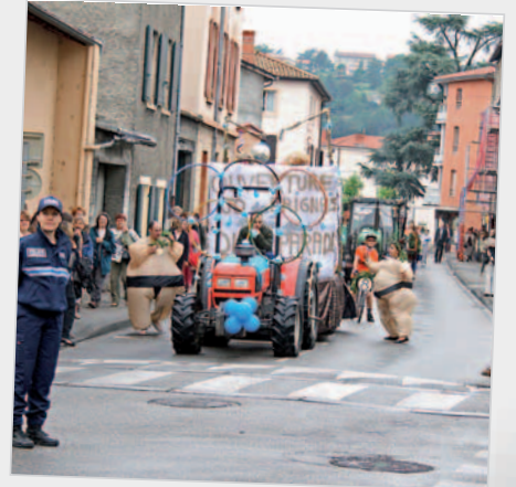
Sous les « Vivas » des spectateurs, le cortège progresse...