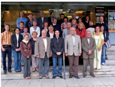
Les représentants des 4 communes, bien décidés à renforcer encore les liens qui les unissent...

Le renouvellement des conseils municipaux des quatre communes (Brignais, Hirschberg, Niederau et Schweighouse) d'ici juin 2009, se traduira par l'impulsion de nouveaux projets. La coopération entre élus devra être renforcée, l'objectif étant de mieux comprendre le fonctionnement de la gestion communale en France et en Allemagne et d'échanger les expériences des uns et des autres.