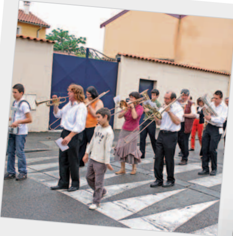
... en cadence au son de l'Harmonie municipale