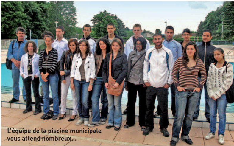
L'équipe de la piscine municipale vous attend nombreux...

Ah l'été, le soleil, les vacances, le farniente... Et la piscine municipale qui vous accueille tous les jours jusqu'à la fin août !