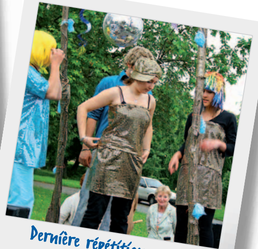
Dernière répétition avant départ sur le char « Disco Parade »