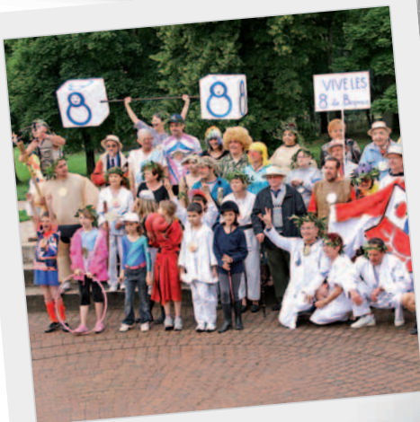
La grande famille du sport en 8 réunie pour la photo