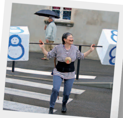
Le poids des ans... n'arrête pas nos sportifs en 8!