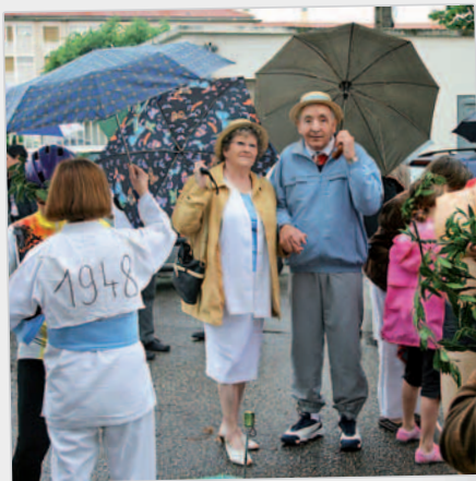
Malgré la pluie, toutes les classes d'âges sont représentées.