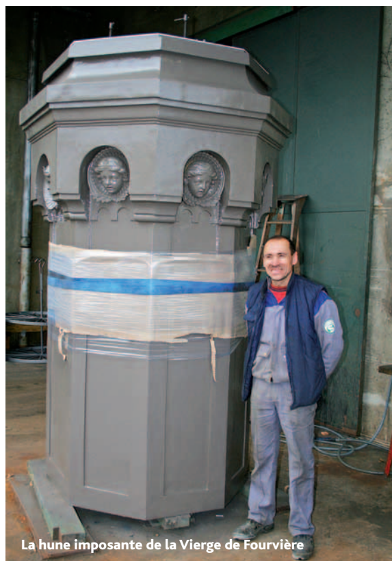
La hune imposante de la Vierge de Fourvière