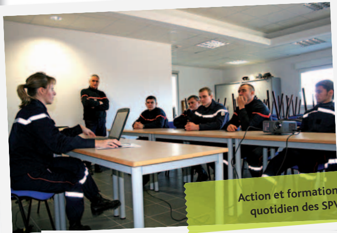
Action et formation : le quotidien des SPV