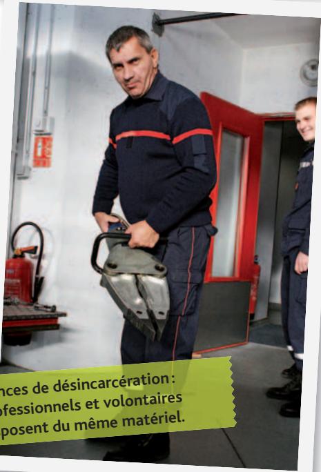
Pincés de désincarcération : professionnels et volontaires disposent du même matériel.