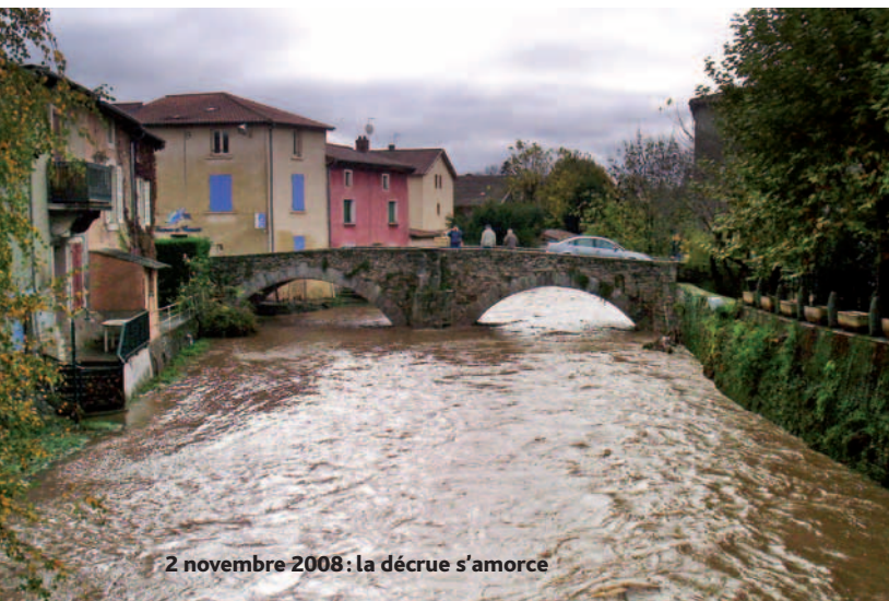
2 novembre 2008 : la décrue s'amorce

« Malgré ces améliorations, cette nouvelle crue nous incite à ne pas relâcher nos efforts. Il y a encore beaucoup de choses à accomplir : équipement en clapets anti-retour de nos réseaux d'eaux pluviales, développement d'une plus grande solidarité amont-aval entre toutes les communes du bassin-versant du Garon, création de barrages écrêteurs susceptibles de contenir une forte augmentation du débit de la rivière... », détaille Paul Minssieux. S