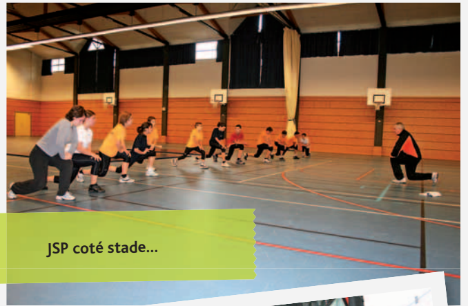
JSP coté stade...