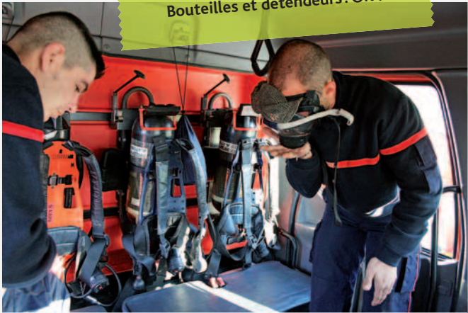
Bouteilles et détendeurs : OK !