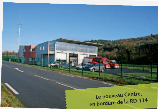
Le nouveau Centre, en bordure de la RD 114

L'engagement et la disponibilité affichés lors des récentes inondations ont encore prouvé, si besoin était, combien les sapeurs pompiers de Vourles - Brignais étaient les dignes représentants de ces valeurs ! S