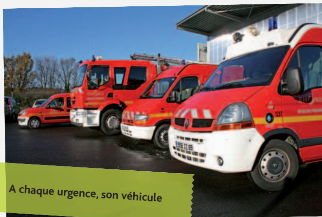
A chaque urgence, son véhicule