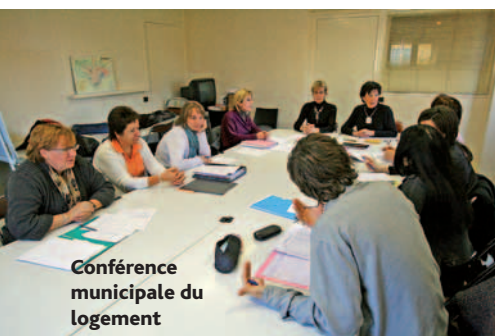
Conférence municipale du logement

« Dans ce contexte, notre rôle au sein de la Conférence municipale pour le logement, qui, depuis 10 ans, regroupe des représentants des bailleurs sociaux, de la Préfecture, de la Maison du Département du Rhône, du Conseil municipal et du CCAS, s'apparente bien souvent à une gestion de l'urgence, au cas par cas », reconnaît l'élue brignairote. Qui se veut néanmoins positive pour l'avenir : « Le PLH en cours d'élaboration