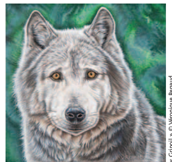
« Cripoff » © Véronique Renaud

n'y aura plus de place pour l'Homme. ». Ni pour l'art animalier... S