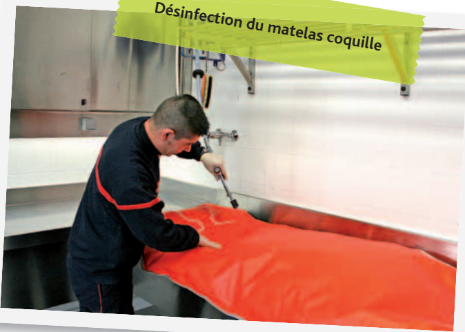
Désinfection du matelas coquille