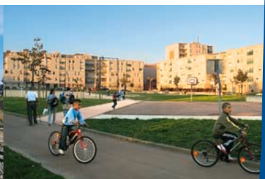
1991 - Ouverture du groupe scolaire Jacques Cartier