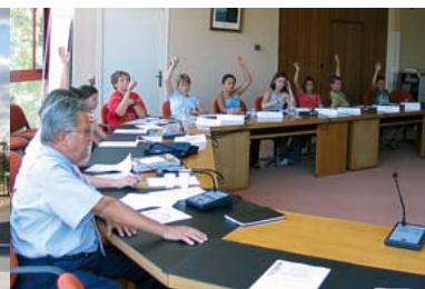
2002 - Création du Conseil municipal junior