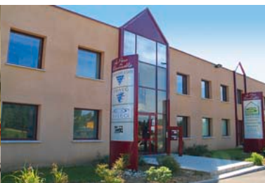
2004 - Création et emménagement dans la Maison Intercommunale de l'Environnement