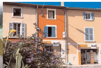
2005 - Opération façades