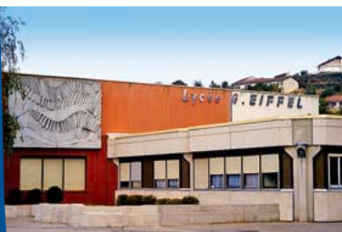
1981 - Ouverture du Lycée Professionnel Gustave Eiffel

Nous y reviendrons... Vous évoquez l'électorat de Brignais; si nous revenons au cœur de vos élections successives, vous vous