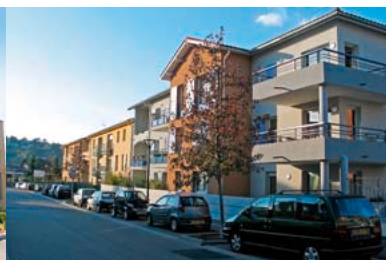
2004 - Construction de la ZAC Garon Hôtel de Ville et création de la rue Jeanne Pariset