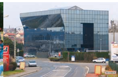
1989 - Implantation de Polygone devenu en 2003 GL Events