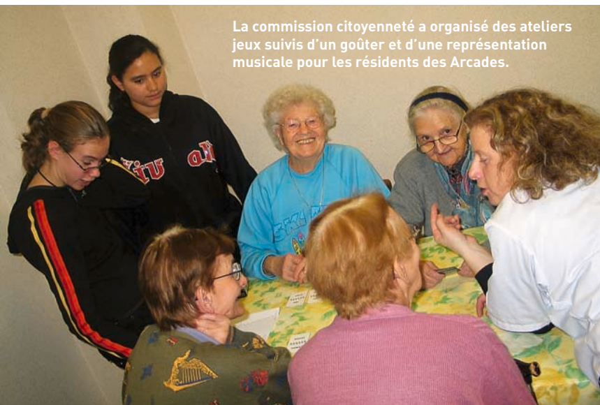
La commission citoyenneté a organisé des ateliers jeux suivis d'un goûter et d'une représentation musicale pour les résidents des Arcades.