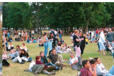
1985 - Ouverture du Parc de l'Hôtel de Ville