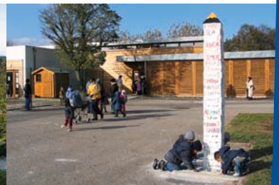
2005 - Restructuration du groupe scolaire Jean Moulin - André Lassaragne