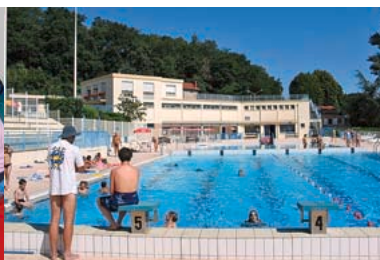
2000 - Rénovation de la piscine