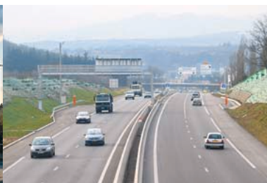
2005 - Mise à 2 fois 2 voies de l’A450 entre Saint Genis Laval et Brignais