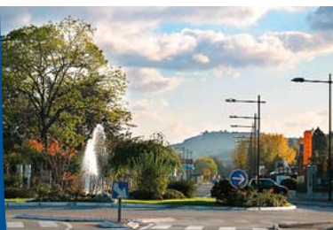
2005 - Réaménagement entrée Sud de Brignais