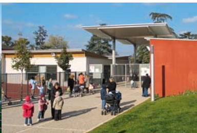
2004 - Reconstruction du groupe scolaire Claudius Fournion