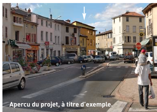
Aperçu du projet, à titre d'exemple.

■ Dans le cadre de la requalification de son centre-ville, la commune a cédé une parcelle de 220 m 2 située sur le domaine public, à l'angle des rues Général de Gaulle et Simondon. Un projet privé, englobant également le bâti ancien occupé jusque-là par la bijouterie, y verra le jour fin 2006. Il consistera en la construction d'un petit immeuble d'habitation avec rez-de-chaussée commercial. Il permettra également de recréer un alignement du bâti sur la rue et de mettre fin à un usage problématique en terme de pratiques sociales sur ce secteur. ■