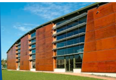
1999 - Construction du Brisport

“ Pour qu'une commune avance... Il faut savoir défendre ses dossiers...”