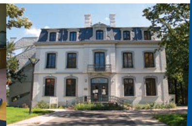
2002 - Réhabilitation de la Villa de la Giraudière