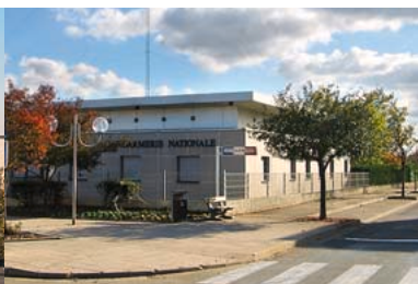
2002 - Extension de la Gendarmerie