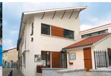
2000 - Ouverture du Forum des jeunes et de la culture.