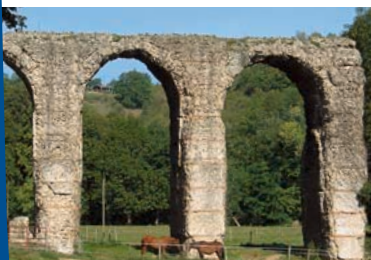
2003 - Classement Espace naturel sensible de la Vallée du Barret

Michel Thiers: Aider, Servir... la difficulté; j'aime bien la compétition, c'est mon tempérament. Et jusque dans la sphère privée, j'ai trouvé un appui