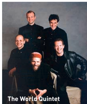
The World Quintet

Ça va jazer : Ray Lema : 10 février à 20h30 et The world quintet : 11 février à 20h30 - A vent... propos : 10 mars à 20h30 - Les castelets de fortune : 14 mars à 19h30 (à partir de 8 ans) - Le Misanthrope de Molière : 24 mars à 20h30.