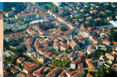
Préservation du Centre historique de Brignais