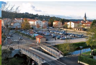
2005 - Requalification de la place du marché