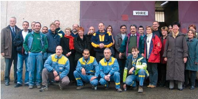
Services techniques et élus, réunis pour fêter la nouvelle distinction.