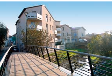
2004 - Création de passerelles dans le centre ville