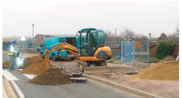
Mi-décembre, réalisation de travaux d'assainissement pour raccorder le futur sanitaire, situé en bas, à droite des escaliers.

■ L'entrée des jardins familiaux est réaménagée afin de concevoir une aire de convivialité plus adaptée aux lieux : accès en pente douce, création de marches d'escaliers, installation d'un sanitaire, pose d'un auvent et aménagement d'un point de rencontre en bois pour y installer tables et chaises seront réalisés. La livraison finale est prévue pour le printemps. ■