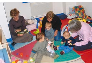
1999 - Transfert de la crèche familiale "L'Arc en Ciel" aux Arcades