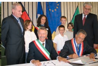
2003 - Signature de la charte de jumelage avec Ponsacco (Italie)