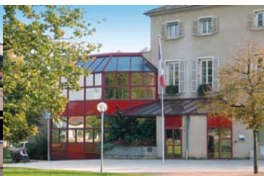
1985 - Inauguration de l'Hôtel de Ville