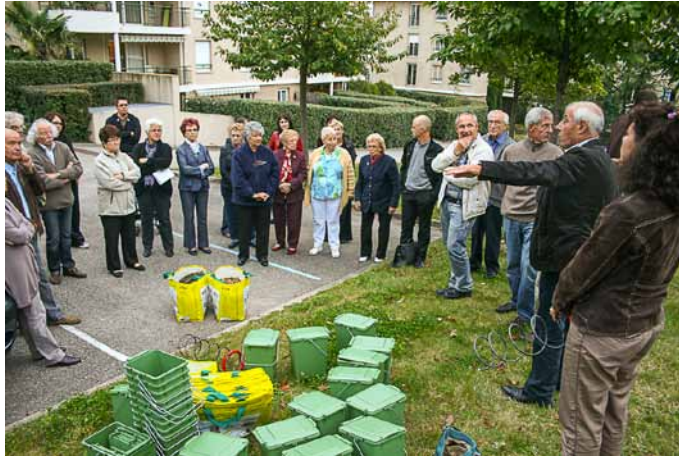
Inauguration du composteur collectif Allée de la Table romaine le 1 er octobre

SITOM Le compostage collectif a le vent en poupe. Preuve en sont les opérations initiées par le SITOM en 2012. A Brignais, déjà deux résidences (bd des Allées fleuries et allée de la table romaine) ont pu être équipées. L'enjeu : détourner les déchets fermentescibles des bacs à ordures ménagères afin de réduire les volumes de déchets collectés.