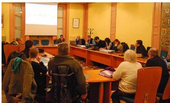
Le comité en séance de travail le 4 décembre dernier