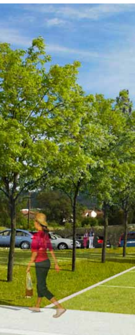
Vue non contractuelle

Après le programme technique en mai 2012, et l'avant-projet sommaire en décembre, le Comité pourrait être prochainement consulté sur divers sujets comme l'organisation fonctionnelle des lieux, l'usage des espaces extérieurs, l'attribution des créneaux horaires aux associations ou encore le choix du mode de gestion de l'équipement. ☆