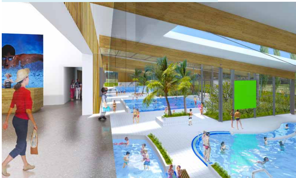
Vue non contractuelle